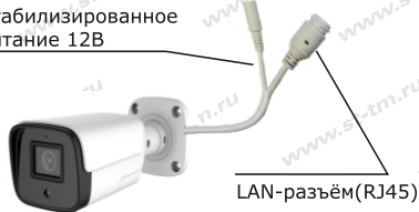
Рис. 1 Схема подключения видеокамеры