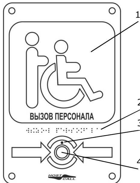
Рисунок 1. Внешний вид радиокнопки вызова МР-413W14

Радиокнопка вызова МР-413W14 ( рис.1 ) выполнена в виде прямоугольной тактильной таблички из ПВХ с нанесенной пиктограммой и надписью ВЫЗОВ ПЕРСОНАЛА обычным шрифтом ( рис.1, поз.1 ) и шрифтом Брайля ( рис.1, поз.2 ) Материал корпуса обеспечивает пыле- и влагостойкость конструкции, соответствующие группе IP44. В нижней части корпуса установлена влагостойкая кнопка синего цвета ( рис.1, поз.4 ). Кроме того, на лицевой панели имеется светодиод ( рис.1, поз.3 ), который обеспечивает индикацию посылки вызова.