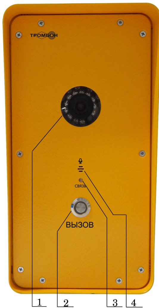
Рисунок 1 - Вид спереди